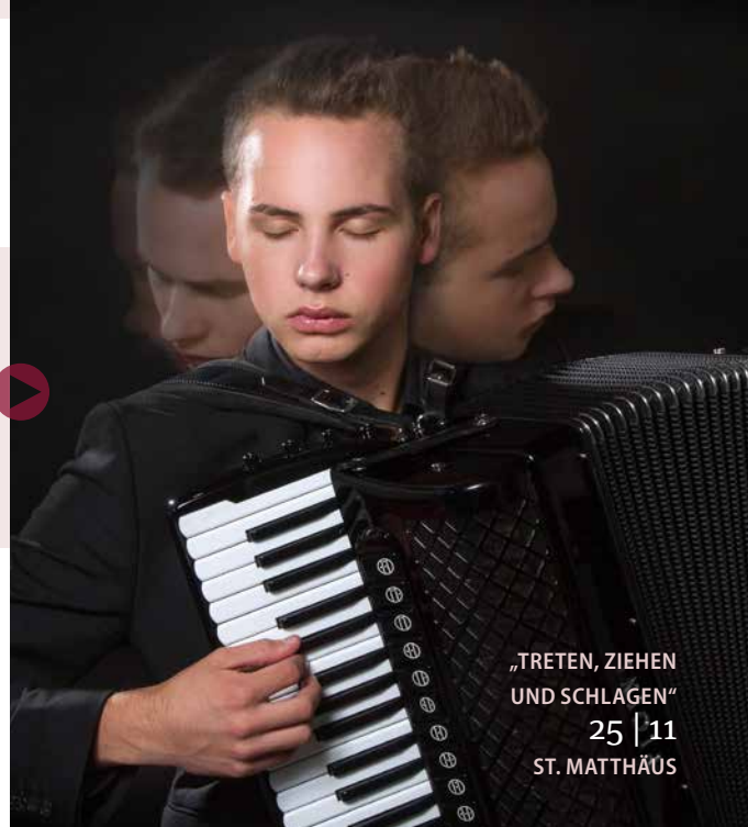
„TRETEN, ZIEHEN UND SCHLAGEN“ 25 | 11 ST. MATTHÄUS