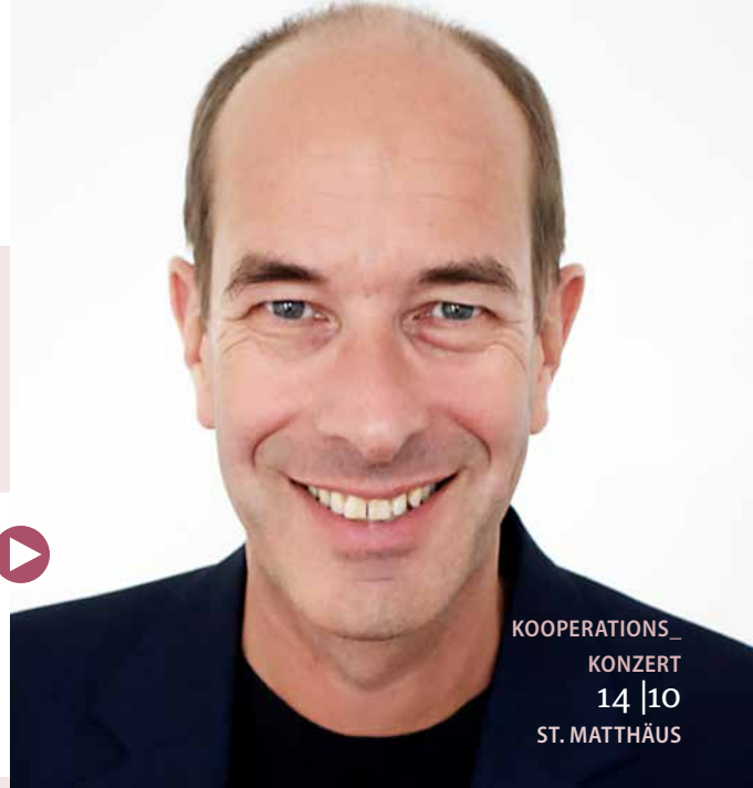
KOOPERATIONS_ KONZERT 14 | 10 ST. MATTHÄUS