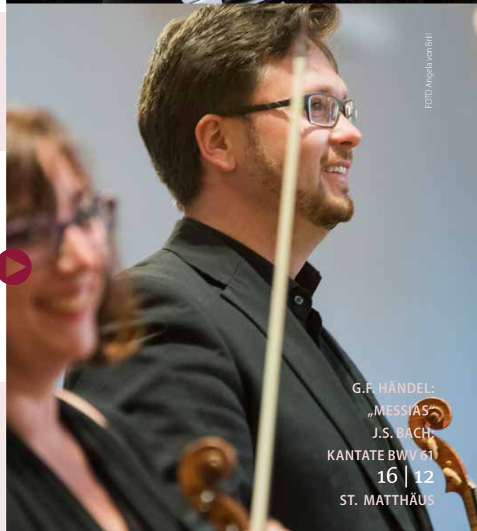
G.F. HÄNDEL: „MESSIAS“ J.S. BACH: KANTATE BWV 61 16 | 12 ST. MATTHÄUS

KIRCHENMUSIK IN MELLE ST. MATTHÄUS ST. PETRI