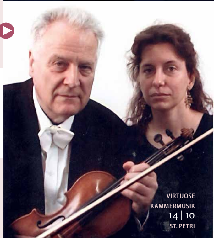
VIRTUOSE KAMMERMUSIK 14 | 10 ST. PETRI